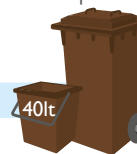
bidone marrone o bidoncino monofamigliare

NO Pannolini e assorbenti, carta per confezioni alimentari, deiezioni animali, sfalci e potature, mozziconi di sigarette, sacchetti di plastica.