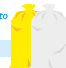
sacco giallo o trasparente

! Rimuovere dal contenitore residui di cibo e di prodotto schiacciare le bottiglie per il verso lungo