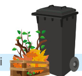
bidone nero o fascine legate in confezioni

! Lunghezza massima delle ramaglie 1 metro